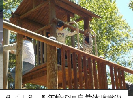
6/18 5年峰の原自然体験学習